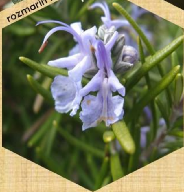
rozmarín lekársky Np