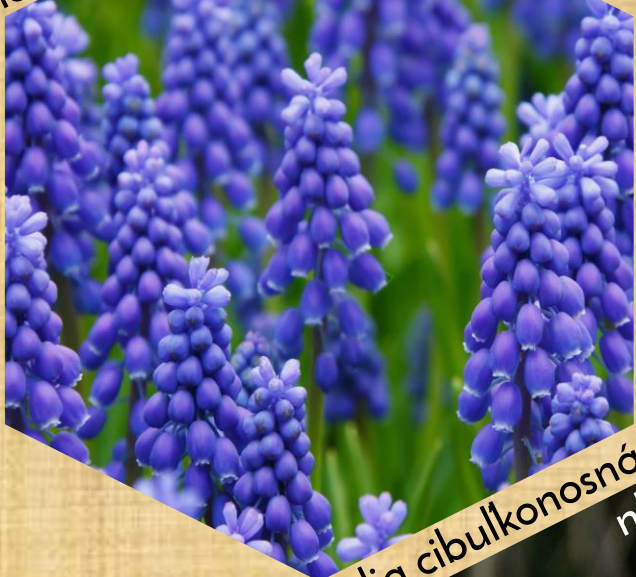
modrinec strapcovitý Np