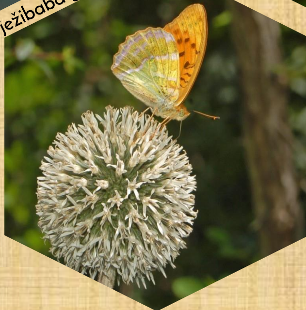
ježibaba guľatohlavá Np