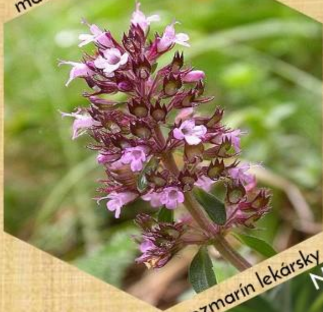
materina dúška Np