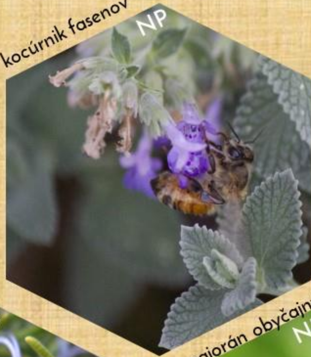
kocúrník fasetov NP