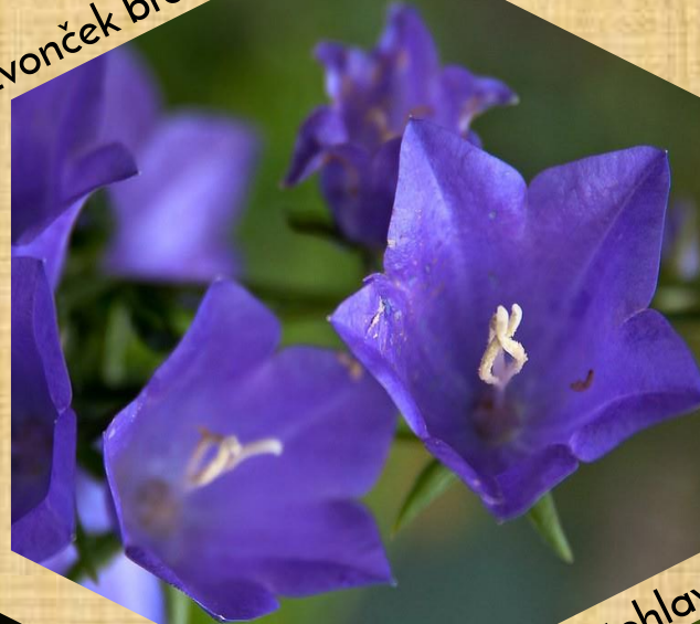
zvonček broskyňolistý Np