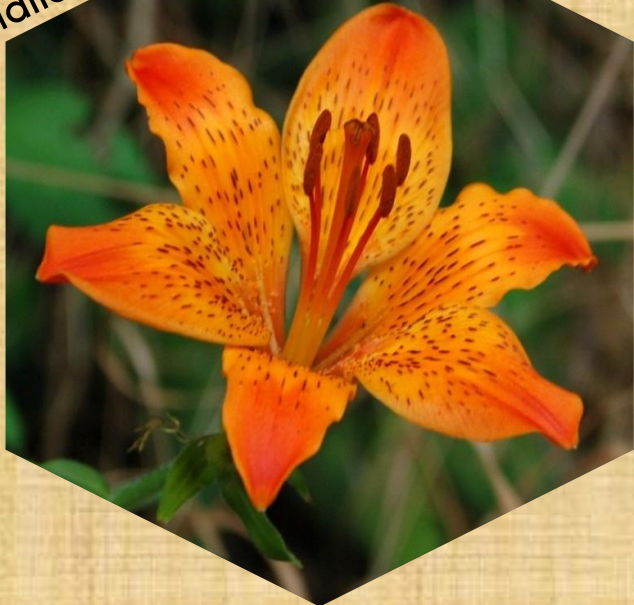
lalia cibulkonosná nP