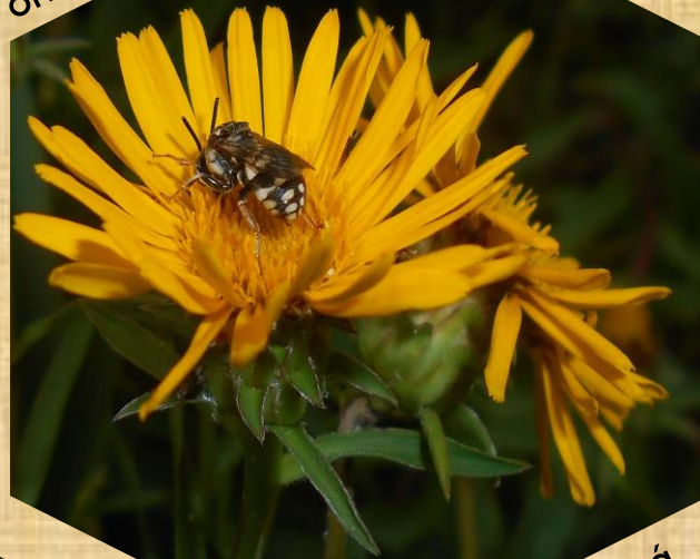
oman mečolistý NP