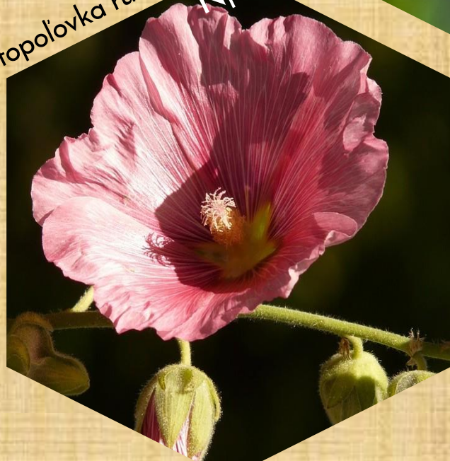
topolovka ružová Np