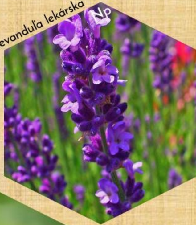
levandula lekárska Np